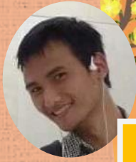
ベトナムの伝統的なお正月