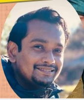
スリランカのお正月