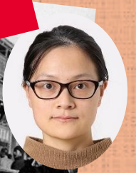
中国 旧正月の過ごし方