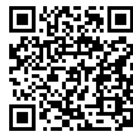
Link to Google MAP™