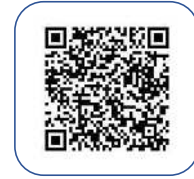
Google マップ™ ヘルプ