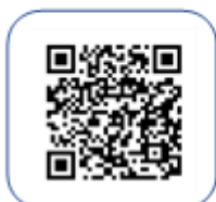
Link to Google MAP™

KICC Mikage Nihongo Plaza 6-12-22, Mikage-honmachi Higashinada-ku, Kobe (Mikage Market “Shisuikan”)